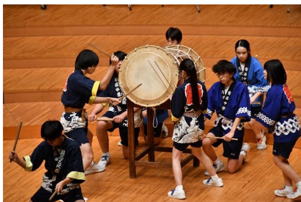
万代太鼓委員会演奏