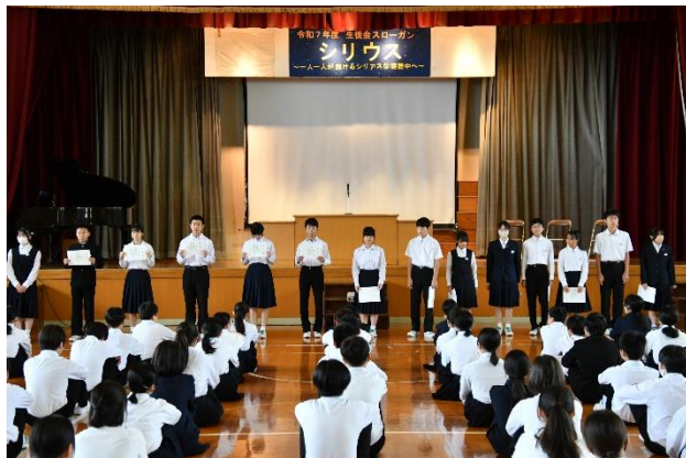
後期学年委員学級委員任命式