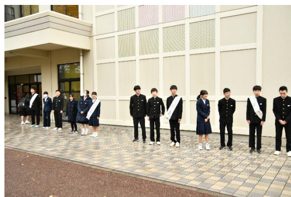
生徒会役員選挙の街頭挨拶